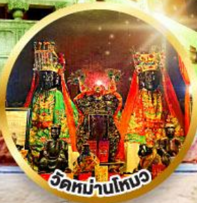
ขอพรเรื่องการศึกษา, การงาน สติปัญญาและความกล้าหาญ