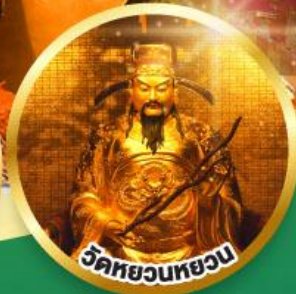
ขอพรเรื่องสุขภาพ, โชคลาภ ความสำเร็จก้าวหน้า

เมนูพิเศษ! ต้มช่าฮ่องกง, บุฟเฟ่ต์ชาบูสไตล์ฮ่องกง, ห่านย่าง