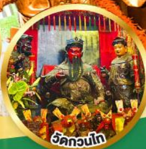
ขอพรเทพเจ้ากวนอู เงินทอง, ธุรกิจมั่นคง