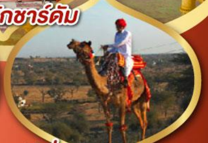
ฟรี ขี่อูฐ เมืองมันทอวา ราคาเริ่มต้น