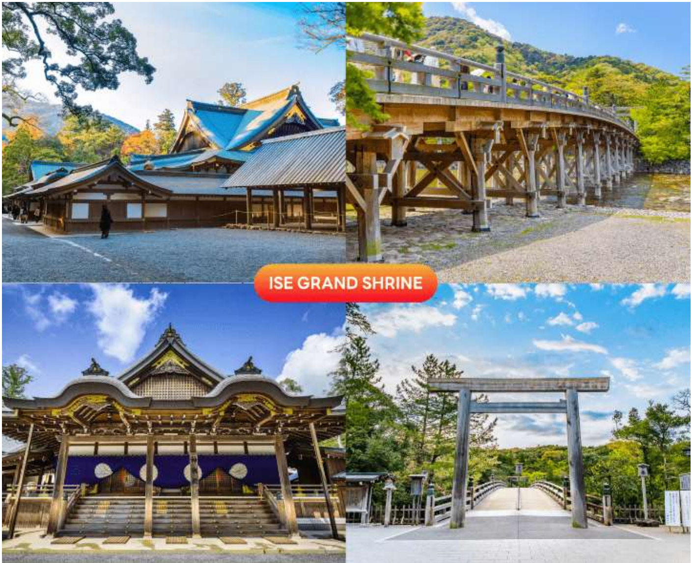
ISE GRAND SHRINE

นำท่านสู่ ศาลเจ้าอิเซะ (Ise Grand Shrine) หนึ่งในศาลเจ้าชินโตที่ศักดิ์สิทธิ์ที่สุดสำหรับชาวญี่ปุ่นตามหลักศาสนาชินโต ธรรมชาติรอบตัวล้วนมีเทพสถิตอยู่ และ ณ ศาลเจ้าอิเซะแห่งนี้เป็นที่ประทับของเทพเจ้าสูงสุด คือ อะมะเตะระสุ โอะมิคะมิ (Amaterasu Omikami) หรือเทพีแห่งแสงอาทิตย์ ต้นกำเนิดของศาลเจ้าอิเซะนั้นไม่ทราบแน่ชัด มีตำนานเล่าว่ากว่าสองพันปีที่แล้ว เจ้าหญิงองค์หนึ่งได้ออกเดินทางแสวงหาสถานที่เพื่อเป็นที่ประทับของเทพอะมะเตะระสุ จนได้ยินเสียงบอกความประสงค์ถึงสถานที่ตั้งศาลเจ้าในปัจจุบัน ( การเปลี่ยนสีของใบไม้ ขึ้นอยู่กับสภาพอากาศเป็นสำคัญ )