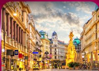
ชมเมืองโรมันติก เวียนนา