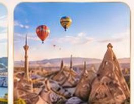
CAPPADOCIA คัปปาโดเกีย