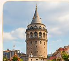
GALATA TOWER หอคอยกาลาตา