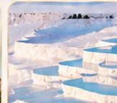
PAMUKKALE ปานุกคาล่า