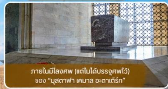
ภายในมีโลงศพ (แต่ไม่ได้รับอนุญาตให้ดู) ของ "มุสตาฟา เคมาล อะตาเติร์ก"