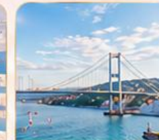
BOSPHORUS STRAIT ช่องแคบบอสฟอรัส