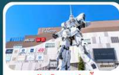
ห้างไดเวอร์ซิตี