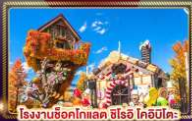
โรงงานช็อคโกแลต ชิโรอิ โคอิบิโคะ

เที่ยวชมเมืองซัปโปโร ในช่วงต้นแปะทิวบานสะพรั่ง เต็มอิมในทริปเดียว ซิม ซ้อป เที่ยว