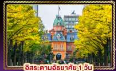
อิซะ-ตามอิซายาคิ 1 วัน