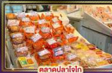
ตลาดปลาโจก