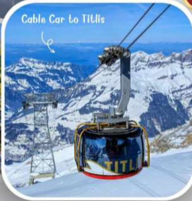
Cable Car to Titlis