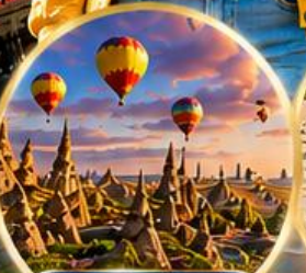
เมืองคัปปาโดเกีย Cappadocia