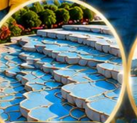
ปานุกคาล์ Pamukkale