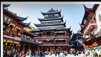
ตลาดร้อยปีเจียงหวงเหมี่ยว