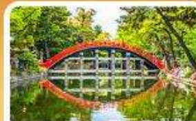
ศาลเจ้าสุมิโยชิ โกเบ