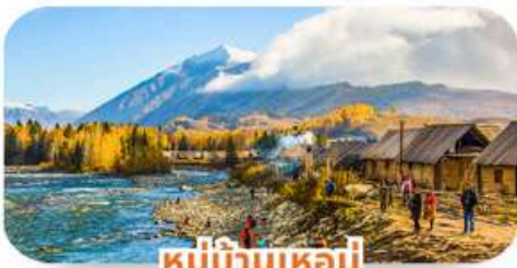
หมู่บ้านเหอมี