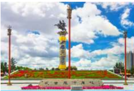
จัตุรัสวงกิสข่าน

หลังอาหารนำท่านเดินทางสู่เมือง ไห่ลาเอ๋อ 海拉尔市 (ระยะทาง 456 กม. ใช้เวลาเดินทางราว 5 ชั่วโมงครึ่ง)