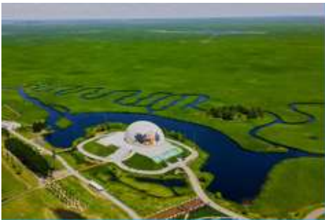
อุทยานชุ่มชื้นจาหลง

รับประทานอาหารเช้า ณ ห้องอาหารของโรงแรม (7)