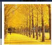
สวนเอ็กซ์โป