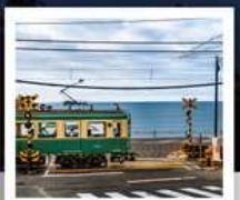
รถไฟเอโนะเด็ตสึ