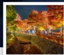
อุโมงค์เมบิซึ