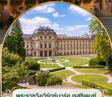
พระราชวังเวิร์ทซ์บวร์ค เรสซิเดนซ์