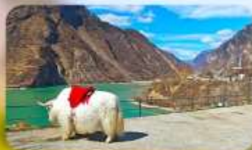
ทะเลสาบเค่อซี