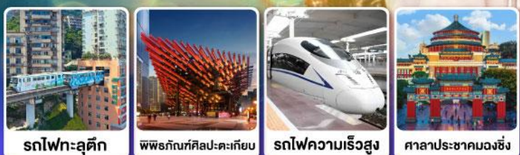
สทไฟกะสุติก | พิพิธภัณฑ์ศิลปะ-ตะเกียบ | รถไฟความเร็วสูง | ศาลาประชาคมฉงชิ่ง