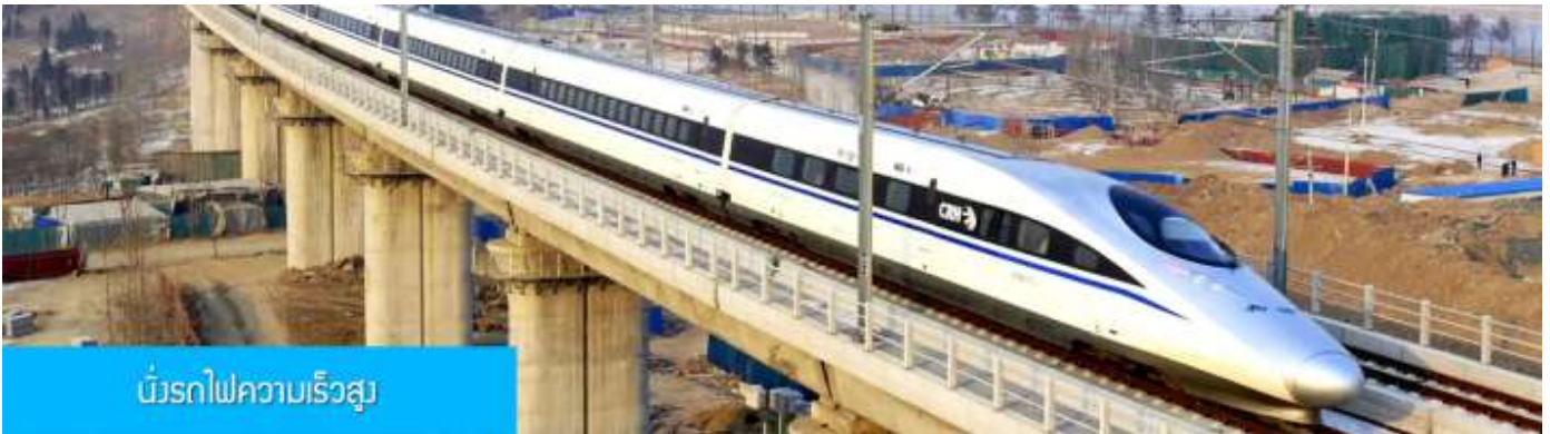
เมืองรถไฟความเร็วสูง

หลังอาหารนำท่านเดินทางสู่สถานีรถไฟความเร็วสูงนครซีอาน เพื่อเตรียมเดินทางสู่นครฉว่หยาง