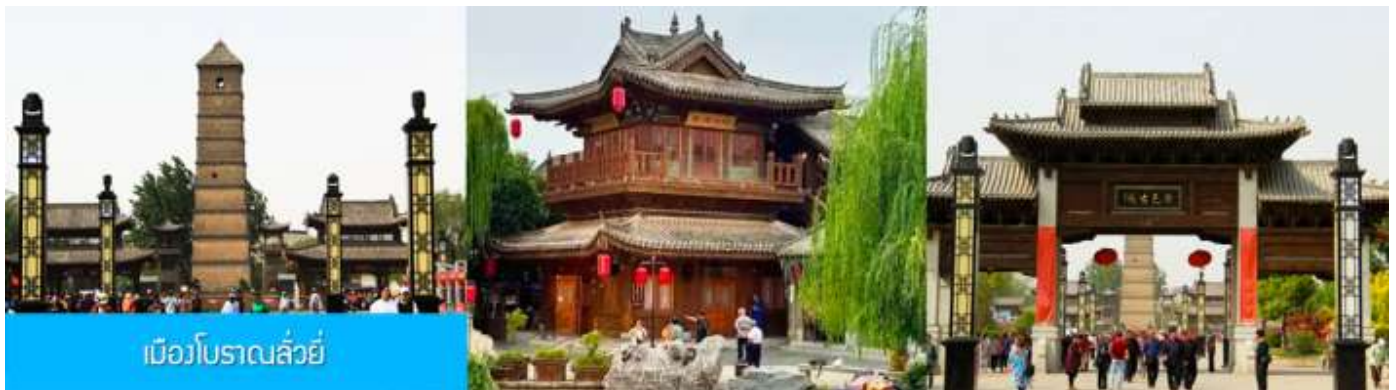
เมืองโบราณฉว่หยี่

16.18 น. ขบวนรถไฟนำคณะเดินทางถึงสถานีรถไฟนครฉว่หยาง นำคณะขึ้นรถบัสเพื่อเดินทางสู่นครฉว่หยาง