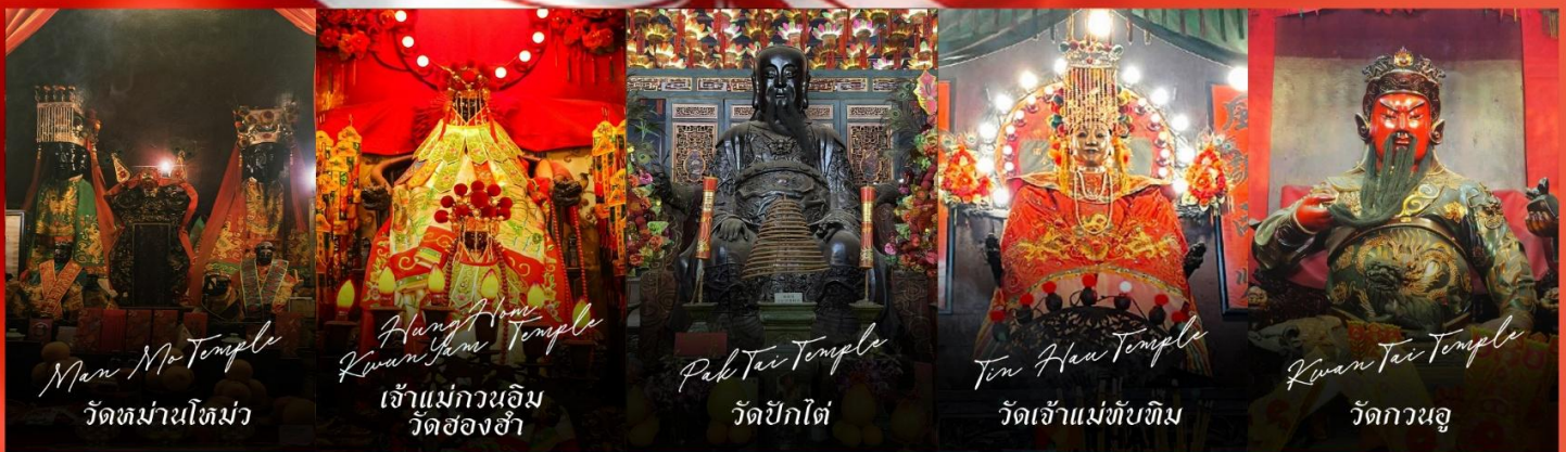
Man Mo Temple วัดม่านไผ่

รายการทัวร์ข้างต้นอาจมีการปรับเปลี่ยนเพื่อความเหมาะสม