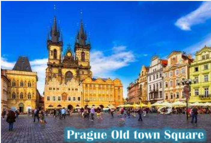
Prague Old town Square