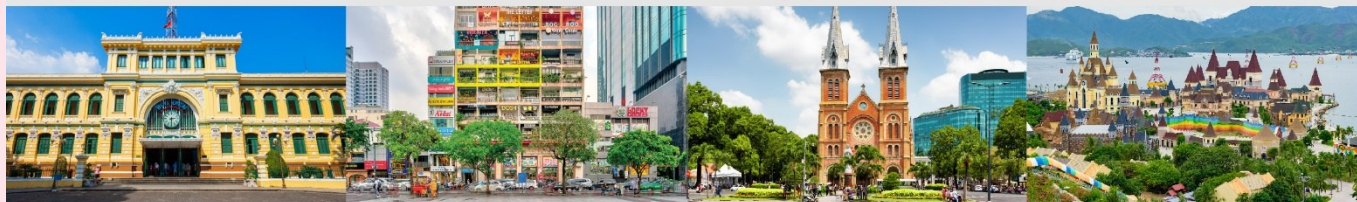
ไพรบ์นีย์กลางโฮจิมินห์