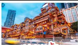
เฉิงเฉิงเฉิง

อุทยานหุบหม่นบ่อฟ้า - อุทยานเขานางฟ้า หงหยาดัง - นั่งรถไฟทะเลสาบ - อุทยานสี่ดรุณี ปี้เฉิงโกว - สะพานหนานเฉียว