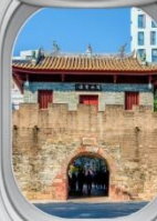
เมืองโบราณหนาวโกว