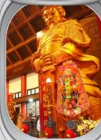
วัดฯชางหมิว