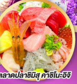
ตลาดปลาชิบุงุ คาชิโนะอิชิ