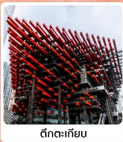
ตึกทะเลียม