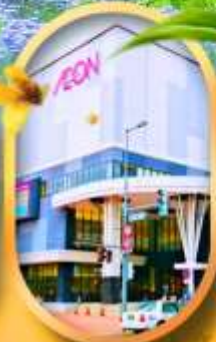
อีออนมอลล์