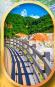
โนโบริเบทสึ