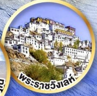
พระราชมังคลา