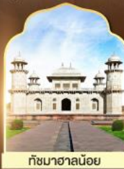
ถ้ำมาฮาลัน้อย