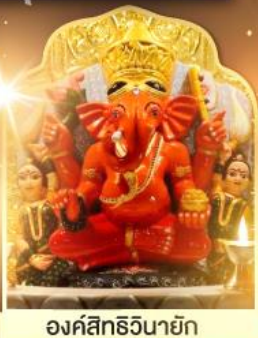
องค์สิทธีวินายก