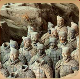
“สุสานจีนซีฮ่องเต้”