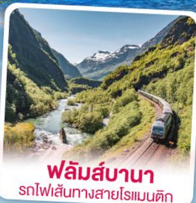
พลัมส์บานา รถไฟเส้นทางสายโรแมนติก