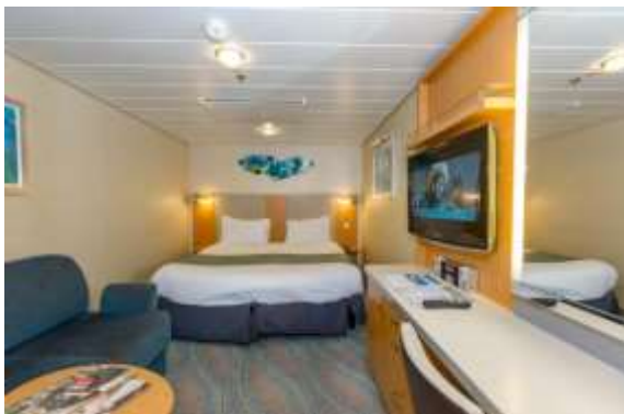
OCEAN VIEW CABIN